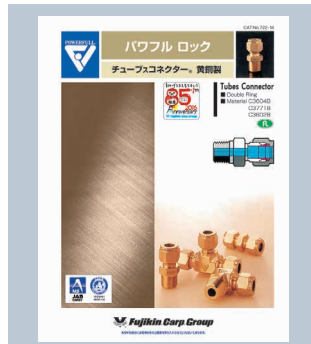
パワフルロック 黄銅製