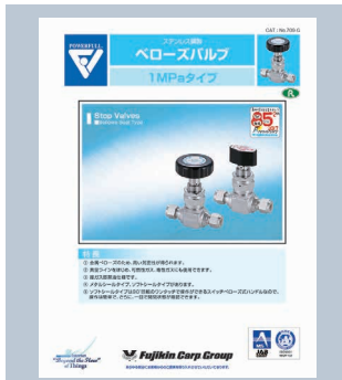
ヘローズバルブ 1MPaタイプ