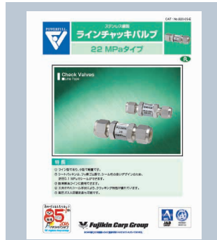
ラインチェックバルブ 22MPaタイプ