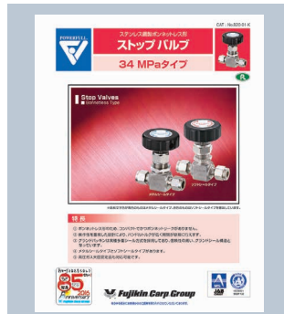
ストップバルブ 34MPaタイプ