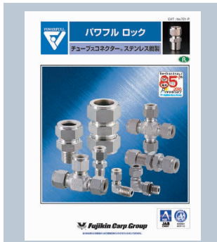
パワフルロック ステンレス鋼製