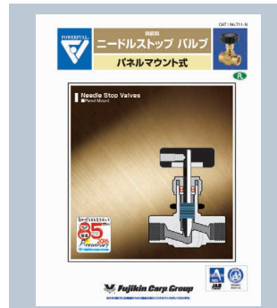
ニードルストップバルブ パネルマウント式