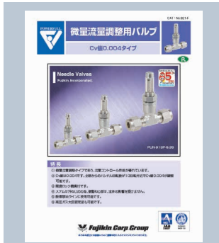
微量流量調整用バルブ Cv値 0.004タイプ