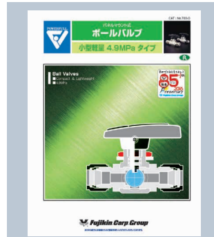
ボールバルブ 4.9MPaタイプ