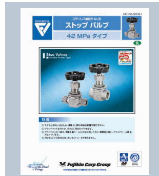
ストップバルブ 42MPaタイプ